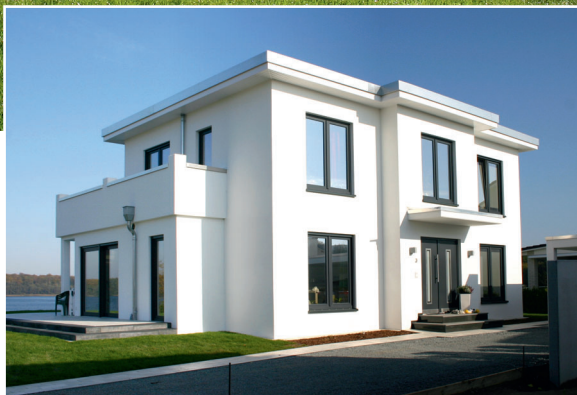
Geradlinig, klar, modern und repräsentativ – so stand's auf der Wunschliste und so sieht auch das Ergebnis aus.