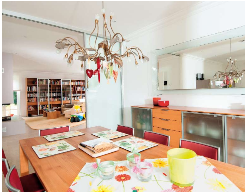
Große Spiegel erweitern die offenen und hellen Räume optisch zusätzlich. Im Essbereich löst der geschwungene Lüster die strenge Linie des Hauses bewusst auf.

intelligenter BUS-Haustechnik. „Ich wollte als Unternehmer etwas unternehmen“, denn Engagement ist gefragt. Es gibt zwar in einigen Regionen wie beispielsweise Baden-Württemberg Pilot-Projekte zum Thema intelligente Stromnetze, in weiten Teilen Deutschlands sieht es in der