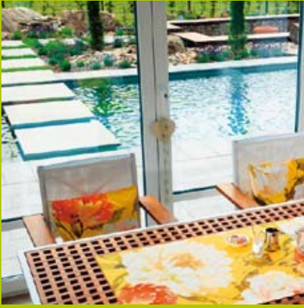
Eine Achse des Hauses wird in einen römischen Garten fortgeführt. Neben einem Feuerplatz gibt es auch einen Badeteich, der mit Zyperngras natürlich gereinigt wird.