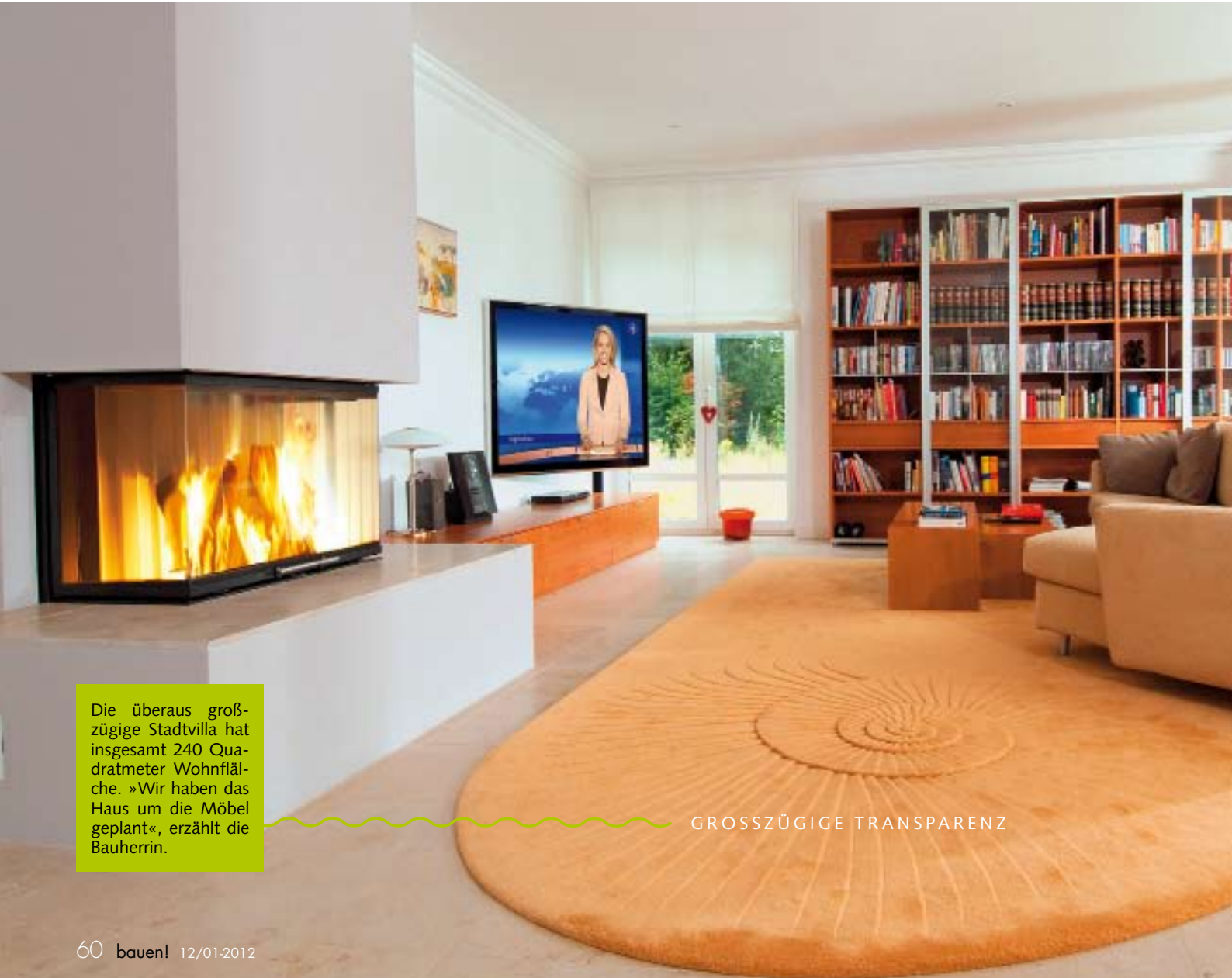
Die überaus großzügige Stadtvilla hat insgesamt 240 Quadratmeter Wohnfläche. »Wir haben das Haus um die Möbel geplant«, erzählt die Bauherrin.